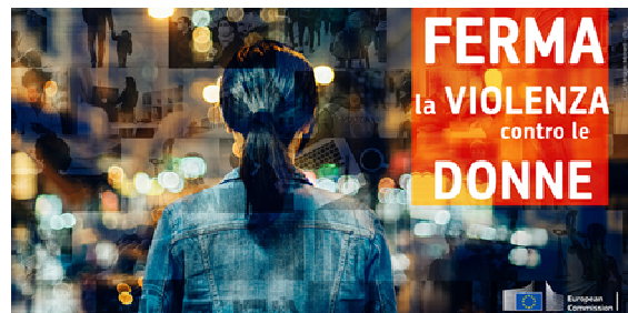
European Commission- Commissione europea

https://italy.representation.ec.europa.eu/notizie-ed-eventi/notizie/entra-vigore-la-direttiva-dellue-sulla-lotta-alla-violenza-contro-le-donne-2024-06-13_it (Rappresentanza italiana Commissione Europea)