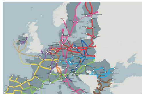
Trans-European transport network (TEN-T)

https://italy.representation.ec.europa.eu/notizie-ed-eventi/notizie/nominati-nuovi-coordinatori-europei-guidare-il-completamento-della-rete-transeuropea-dei-trasporti-2024-09-09_it (Rappresentanza in Italia Commissione Europea)