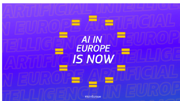
European Commission - DG Connect

https://italy.representation.ec.europa.eu/notizie-ed-eventi/notizie/la-commissione-firma-la-convenzione-quadro-del-consiglio-deuropa-sullintelligenza-artificiale-2024-09-05_it (Rappresentanza in Italia Commissione Europea)