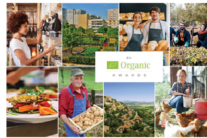
European Union 2024

In occasione della Giornata europea dell'agricoltura biologica 2024 , la Commissione europea annuncerà i vincitori della terza edizione dei premi dell'UE per la produzione biologica. I premi, che comprendono 7 categorie e 8 premi individuali, vengono assegnati a progetti innovativi, sostenibili e stimolanti che apportano un valore aggiunto significativo alla produzione e al consumo biologici. La cerimonia inizierà alle 15:00 nella sala Schuman dell'edificio Berlaymont, a Bruxelles, e sarà trasmessa in diretta streaming. Il Commissario europeo per l'Agricoltura, Janusz Wojciechowski , terrà un discorso all'inizio della cerimonia. I vincitori di quest'anno dimostrano di essere all'altezza degli elevati standard stabiliti dai loro predecessori, presentando progetti sostenibili e stimolanti lungo la catena del valore biologica europea. I progetti vincitori - e le persone che li sostengono - dimostrano come l'agricoltura e la produzione biologica possono creare catene del valore innovative e generare nuove opportunità lavorative nelle zone rurali. La Giornata europea dell'agricoltura biologica è stata istituita nel 2021 quale nuova iniziativa per celebrare e promuovere l'agricoltura biologica, che svolge un ruolo fondamentale nello sviluppo di un sistema alimentare sostenibile per l'UE.