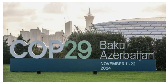
La Cop29 si tiene in Azerbaijan, a Baku