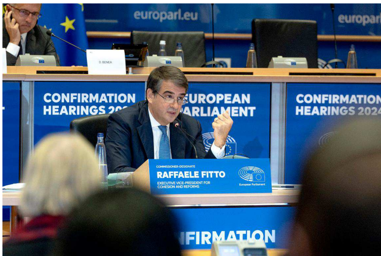
Raffaele Fitto durante l'audizione di conferma 2024 © Unione Europea, 2024 - Fonte: PE

https://www.europarl.europa.eu/news/it/press-room/20241029IPR25049/audizione-del-vicepresidente-esecutivo-designato-raffaele-fitto (Parlamento Europeo)