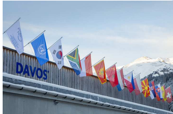
World economic forum

Giovedì 23 interverrà al varo del Forum mondiale per la transizione energetica (Global Energy Transition Forum). L'evento sarà trasmesso in diretta su EBS. I membri del collegio parteciperanno a discussioni su argomenti relativi ai rispettivi portafogli e all'attuale panorama internazionale, tra cui la competitività dell'Europa, la politica industriale e le sue opportunità economiche; le conseguenze della guerra di aggressione della Russia contro l'Ucraina, la situazione in Medio Oriente e l'allargamento; cambiamenti climatici, transizione pulita e tecnologie correlate; Global Gateway e lo sviluppo sostenibile dei paesi partner dell'UE; l'innovazione dei trasporti e il futuro del turismo; filiere alimentari e resilienza idrica, commercio e dazi; e sfide e opportunità della tecnologia e dell'intelligenza artificiale. Il programma completo dell'evento è disponibile sul sito web del forum. Maggiori informazioni e aggiornamenti sugli impegni dei commissari partecipanti saranno disponibili online nel calendario settimanale delle attività dei membri del collegio.