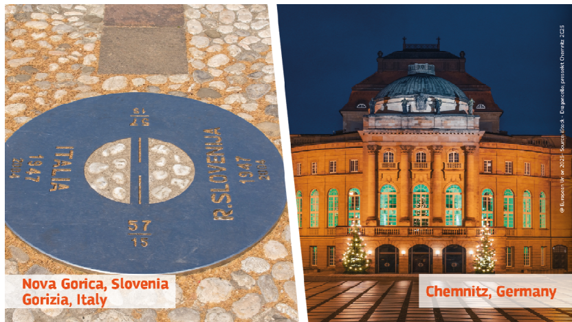
Nova Gorica, Slovenia Gorizia, Italy

Le Capitali europee della cultura sono già state designate fino all'anno 2028.