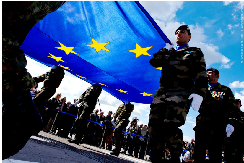
European Union 2014 - European Parliament

https://www.europarl.europa.eu/news/it/press-room/20250310IPR27230/i-deputati-esortano-l-ue-a-garantire-la-propria-sicurezza (Parlamento Europeo)